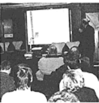
VORTRAG VON L. SCHMOTZ ZUM SACHVERSTÄNDIGENWESEN.

Flaggschiffe in deren Kielwasser sich dann viele andere Unternehmen positionieren würden. Unser Vorstand wird diese Messe, ge-