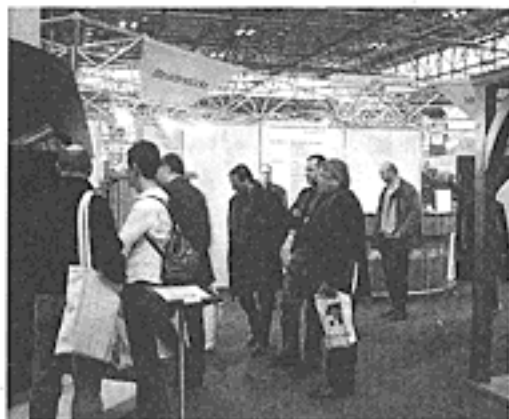
DIE MEISTERSTÜCKE FANDEN IMMER GROßES INTERESSE.